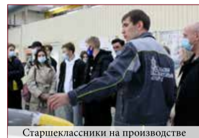
Старшеклассники на производстве

сами и студентами. Тут и знаний побольше, и интерес более профессиональный. Поэтому к восхищению работой станочного парка добавились интересные вопросы о нюансах заготовительной работы, корректировки техпроцессов, техническом контроле и другие. Естественно, на все вопросы производили развернутые ответы от рассказчиков, коими выступали представители руководства производства, в деталях знающие специфику работы цехов.