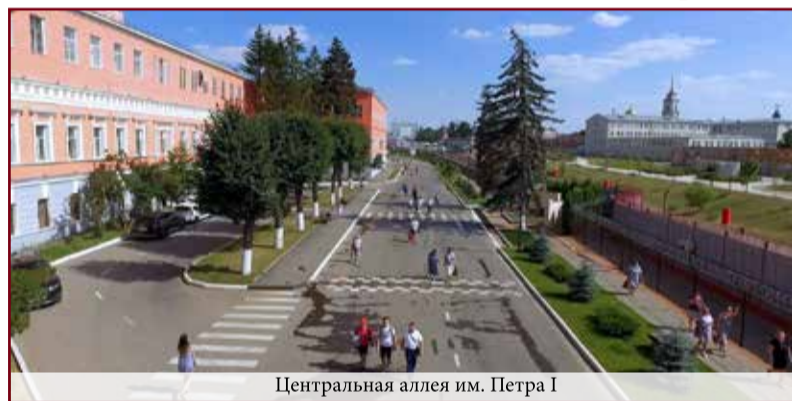
Центральная аллея им. Петра I