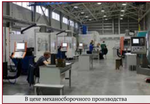
В цехе механосборочного производства

Одновременно, во втором и третьем квартале планируется проведение технологической подготовки и инструментального оснащения для изготовления полностью снаряженного изделия 9М133-1; для изготовления фугасной боевой части 9Н156Ф, снаряженного изделия 9М133Ф-1 с изготовлением установочной серии, проведением квалификационных испытаний с переходом к серийному изготовлению.