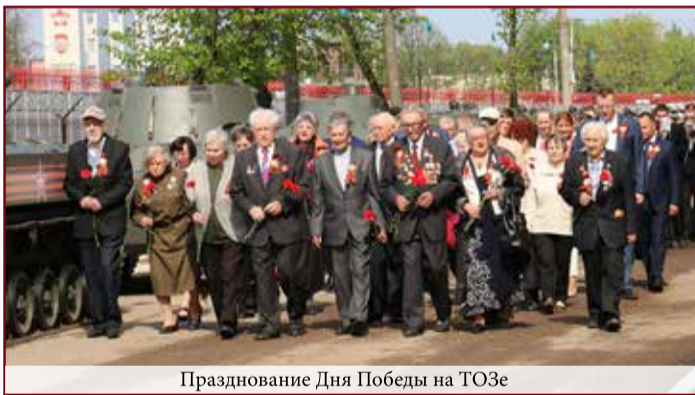
Празднование Дня Победы на ТОЗе