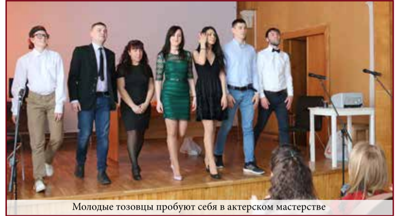
Молодые тозовцы пробуют себя в актерском мастерстве

- оказание помощи детям реабилитационного центра «Искра»; - проведение турниров по мини-футболу, пинг-понгу среди сотрудников и между командами других предприятий;