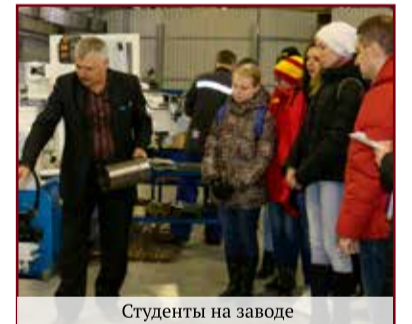
Студенты на заводе

Что касается спорта, то в различных мероприятиях, соревнованиях, турнирах, в том числе организованных Ростехом, активно участвуют около 1000 заводчан. А с учётом тех, кто посещает ещё и современный физкультурно-оздоровительный комплекс на предприятии, число «спортсменов» у нас значительно больше. Это всё уже из разряда организации свободного времени, заботы о здоровье. Хорошо то, что такие занятия связаны с заводской