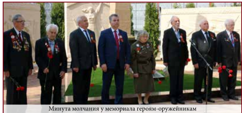
Минута молчания у мемориала героям-оружейникам

Всё дальше в историю уходит героическое время всенародной битвы наших соотечественников в Великой Отечественной войне, но подвиг их не меркнет. Солдат на передовой и старик или подросток на заводе, партизан в тылу врага и колхозница в далёком от фронта селе – каждый как мог, а чаще всего сверх всяких сил, приближал Победу. И только благодаря мужеству и великой любви к Родине наш народ выстоял и победил, принес мир и свободу.